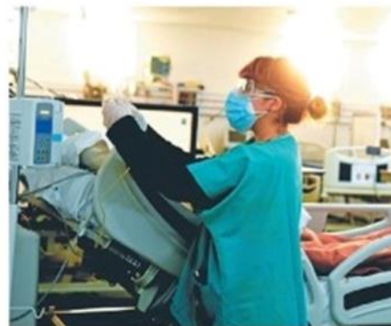
Los costos se dispararon desde la pandemia Covid

"La decisión del Gobierno nacional de implementar este bono de refuerzo a los trabajadores que ganan menos de tres SMVM -equivalente a un monto de $ 185.000- es de imposible ejecu-